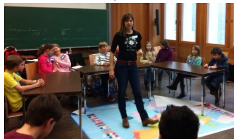
Kinder Uni.