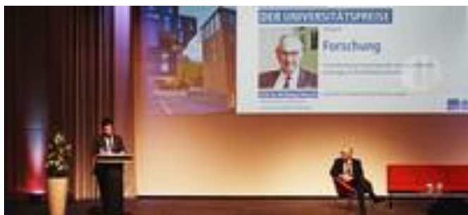
Preisverleihung.