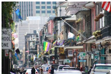
New Orleans.